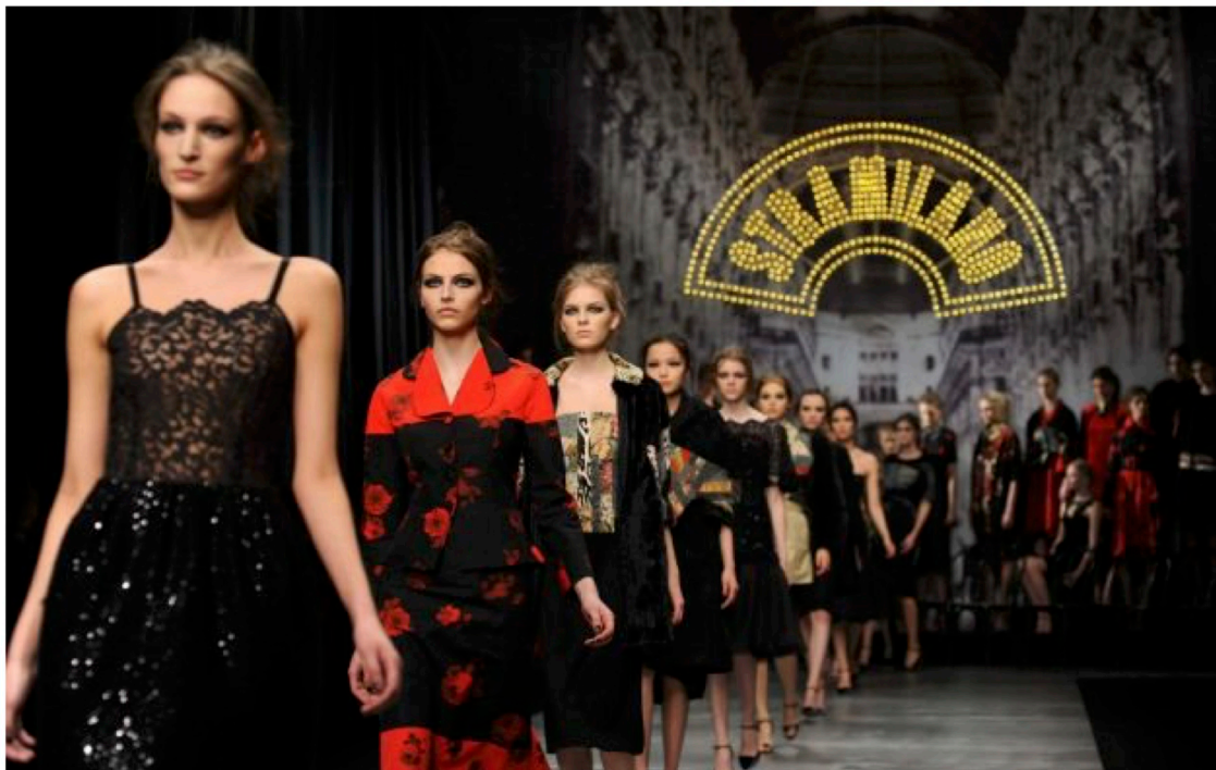
il Comizio.it - Con "Aprite moda" dal 21 al 22 ottobre Milano scopre gli atelier del made in Italy

Sabato 21 e domenica 22 ottobre 2017, in occasione della prima edizione di Apritimoda!, le storiche maison della moda aprono al pubblico i loro spazi privati, per la prima volta, svelando i luoghi